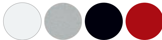
Біла Срібляста Чорна Червона